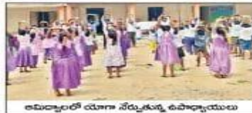
అమిద్వాలలో యోగా నేర్పుతున్న ఉపాధ్యాయులు